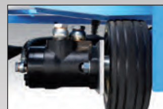
ruota trazione traction wheel