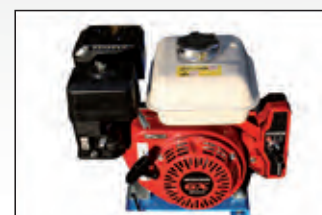
gruppo motore Honda Honda motor unit