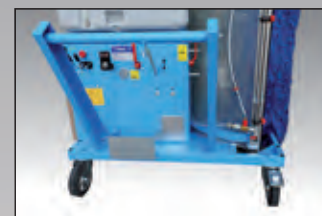
maniglione con comandi controls handle