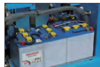
gruppo batteria 24V 24V battery pack