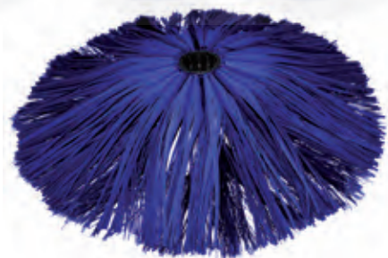
spazzola mista polietilene carlite mixed brush

The brush, made of high density soft material allows a thorough cleaning of large surfaces in a short space of time. Also available with carlite or mixed brush (optional).