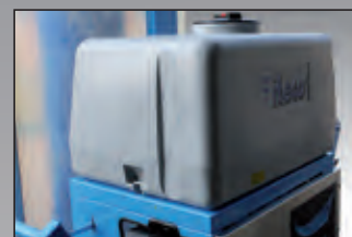
serbatoio acqua water tank