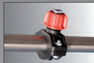
ugello aspersione acqua water sprinkler nozzle

Water tank 300 litres, tilting brush, hydraulic traction, dual controls, brush diameter 1.000 mm.