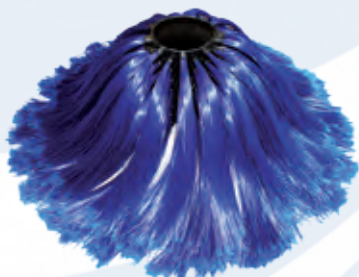
spazzola in polietilene alta densità high density polyethylene brush

EASYWASH 300 is equipped with a tilting facility, therefore the brush always perfectly fits the surface to be cleaned.