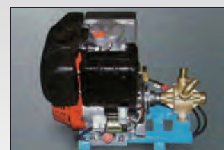
gruppo motore diesel diesel engine unit